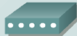
Modem CSU/DSU TA/NT1