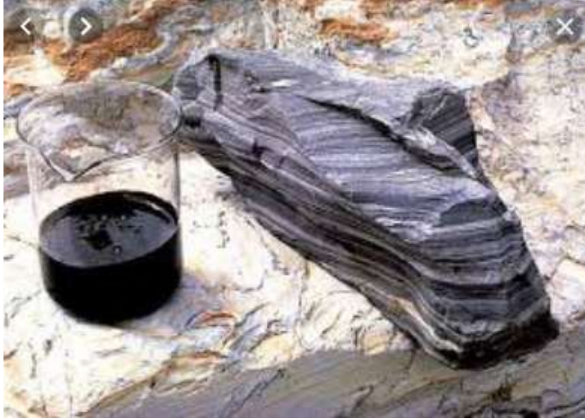
الشكل (1-4) الكيروجين

عبارة عن بوليميرات غير قابلة للذوبان بالمذيبات العضوية ( الكلورفورم ، الاسيتون ، البنزول الكحولي) ويتكون من نوى المركبات الحلقية الكثيفة والتي ترتبط ببعضها عن طريق سلاسل أليفاتية. ولكنها تعطي عند تقطيرها مواد متنوعة مثل النفط والغاز. الشكل (1-4)