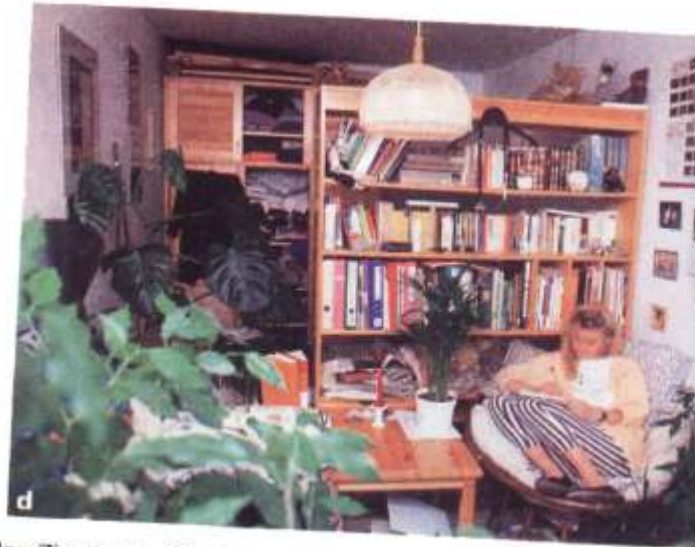
das zimmer im Studentenwohnheim