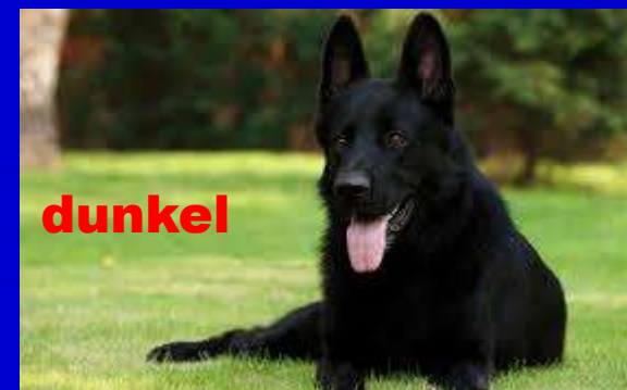
(m) Hund schön hässlich